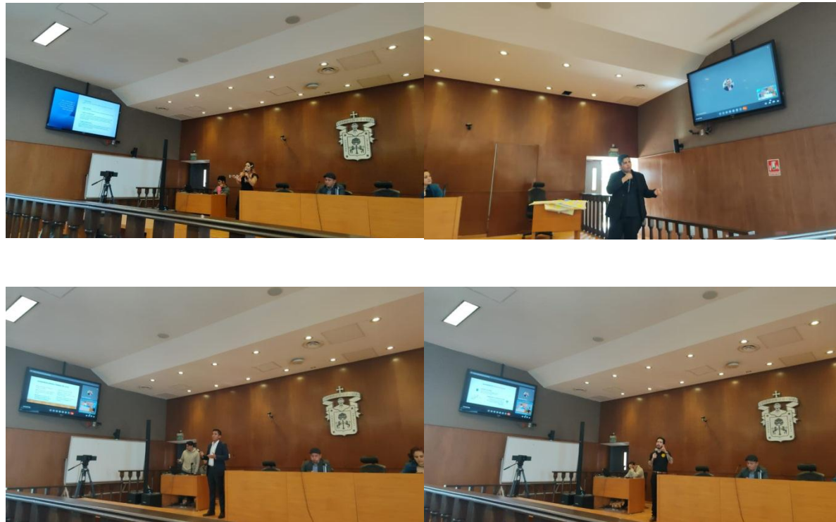
Tonalá, Jalisco, febrero de 2024 Coordinación del Doctorado en Derechos humanos