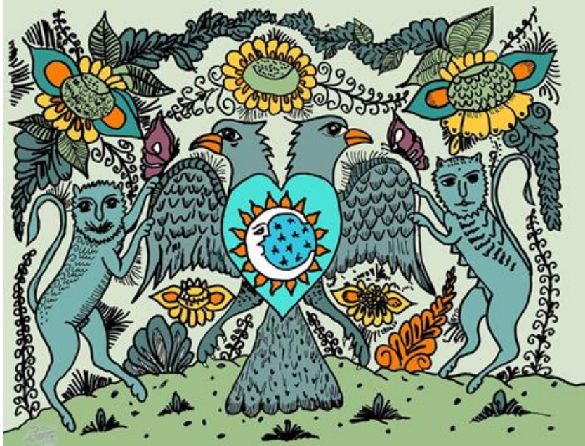
Guardianes de la Paz , 2019, Pablo Pajarito Fajardo.