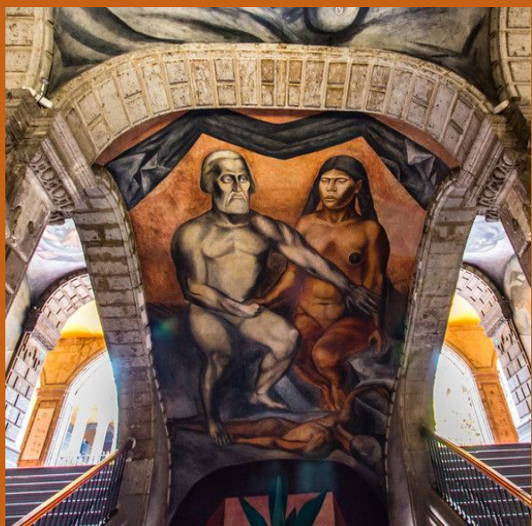
José Clemente Orozco, "Cortés y La Malinche".

Entre las definiciones de la Conquista de México que encontramos en internet, donde suelen "abrevar" nuestros alumnos para informarse, se dice que esta ocurrió entre 1518 y 1521, y fueron las acciones bélicas y políticas dirigidas a someter a los aztecas y vencer la resistencia de los indígenas.