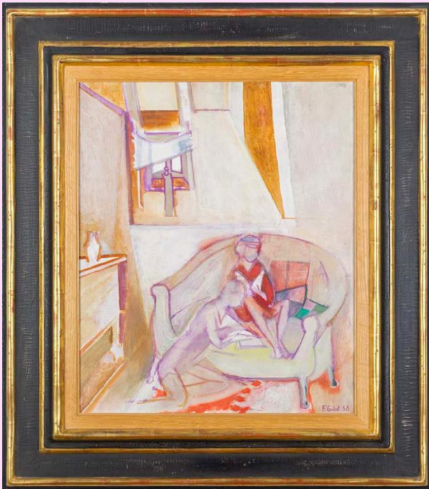
Gilot, F. (1958). Claude & Paloma in the attic [Óleo sobre tela]. Colección Serge Bril Panijel, Nueva York, Estados Unidos.

Si bien su trabajo a finales de los cuarenta fue influenciado por el cubismo de Picasso, sus pinturas se caracterizan por una preferencia por las formas orgánicas sobre el uso de ángulos agudos de Picasso. Gilot no sólo se dedicó a pintar retratos y paisajes, los bodegones también son un motivo recurrente en su trabajo de collage y guache sobre papel, tal y como se puede apreciar en White and red still life y Still life in white and red (Natura morte blanche et rouge) , dos piezas abstractas producidas en 1947. En ellos cada objeto está reducido a una figura plana, la mesa, la pared y los objetos representados. Las líneas curvas de los objetos contrastan con las superficies rectas de la mesa y la pared.